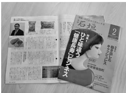
日本商工会議所発行 「月刊 石垣」

なお、記事をご覧になりたい方は宇佐商工会議所ホームページからご覧いただけます。（ http://twinpia-usa.or.jp/ ）