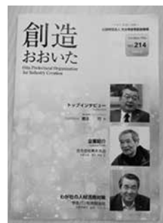
公益財団法人 大分県産業創造機構発行 「創造おおいた」