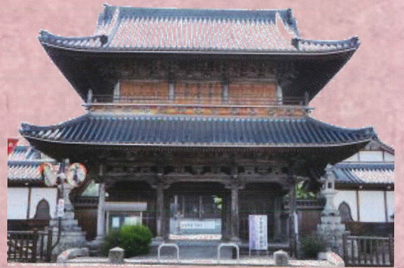
四日市別院山門（大分県指定有形文化財）