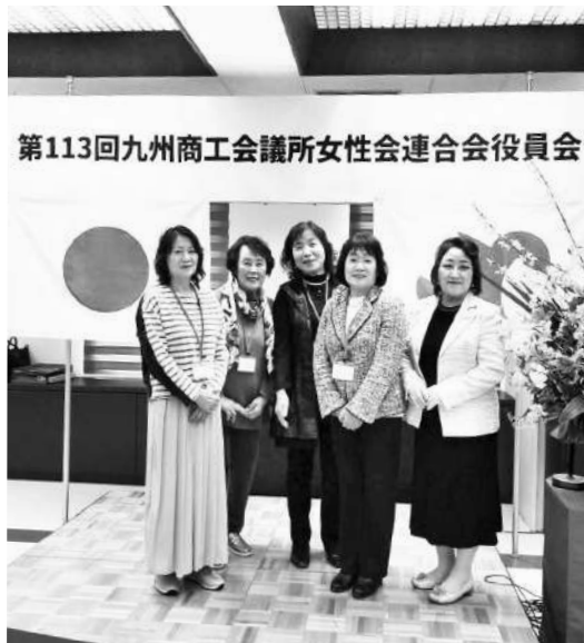
第113回九州商工会議所女性会連合会役員会

昼食のお弁当には各県の名物(大分県はとり天、福岡県は明太子・がめ煮など)が入っており、心づかいの感じられるとても美味しいお弁当でした。