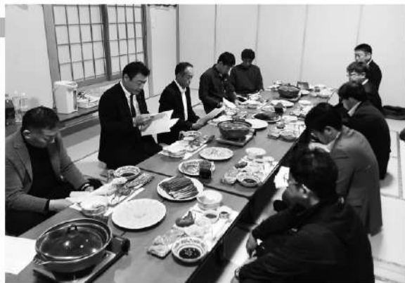
任期：令和7年11月1日～令和10年10月31日

事務局からは、建設業部会の事業として取り組んでいる安全保護具・技能講習等の助成金の報告、予算についての説明を行いました。今後は新たな事業を役員で考案し取り組んでいく予定です。