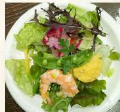
季節の柑橘塩麹 ドレッシング (塩麹)