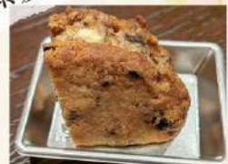
酒粕レーズンバタークッキー (酒粕、甘酒、レーズン)

これらの料理は、今後、改良を重ねてメニュー化や商品化の実現に向けて取り組むこととなっております。 「うさ食文化サロン」では、特産品の再発見、地元食材を生かした創作料理の開発、シェフと参加者、参加者同士のつながりができた取り組みになりました。