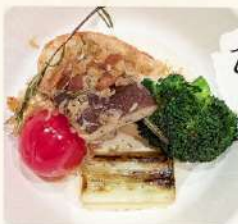
ウサヒージョ (漬けあみ)