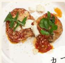
米粉たこ焼き 〜宇佐のつけあみと 2 種の チーズを使ったトマトソースかけ〜 (漬けあみ、チーズ)