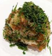
乙女のごちそう 中華おこわ風混ぜご飯 (かちえび、青のり)