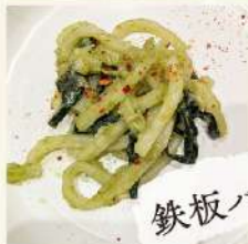
味ーねぎのネギベーゼを使った 『うさんアツミ〜の Pasta』 (味ーねぎ、漬けあみ)